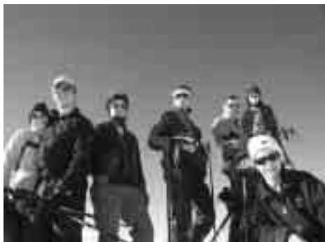
Gipfelfoto auf dem Spitzmeilen.

stöckli auf dem Programm, von wo aus wir hinunter nach Matt und bald einmal in den Nebel fuhren. Die Sonne gespeichert ging es mit Bahn und Postauto nach Hause.