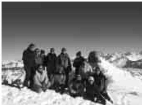
Auf dem Wissmilien. Im Hintergrund der Spitzmeilen.