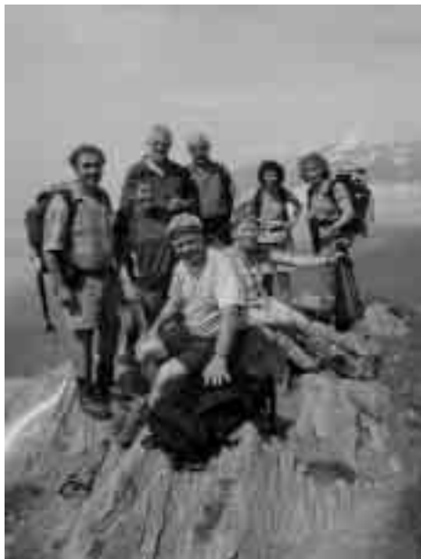
Gipfelfoto auf dem Füürhörnli.

Schon um ½ 12 Uhr erreichten wir das Füürhörnli (1886 m). Alle Teilnehmenden