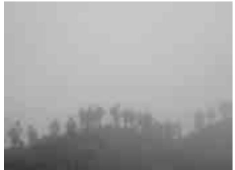
25 Näbelchraiva uf dem Höchsts.