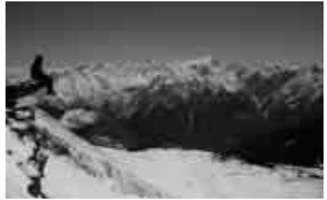
Pizzo di Cadreigh.

bekam ich nämlich zwei und für den Montag keinen. Nun dies ist ja bald nachgeholt.