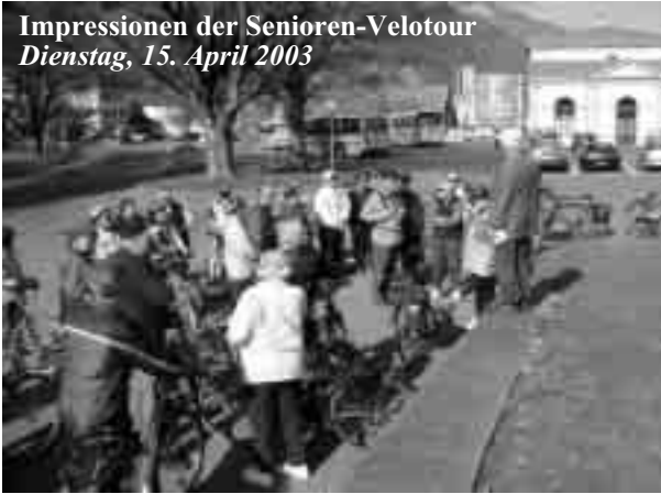
Tourenleiter Paul gibt die nötigen Anweisungen vor dem Start.