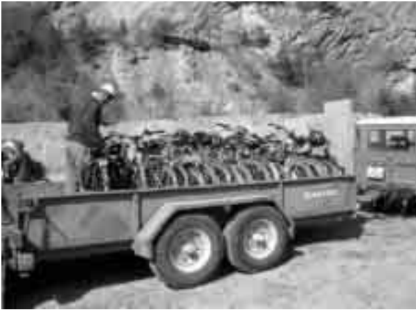
Die Stahlrösser werden verladen ...