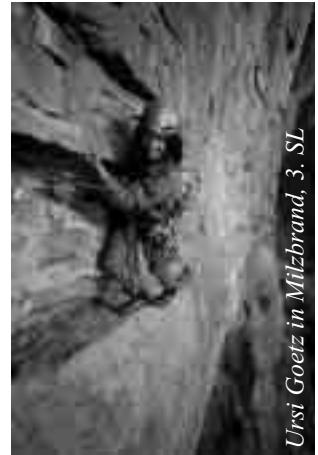
Ursi Goetz in Milzbrand, 3. SL