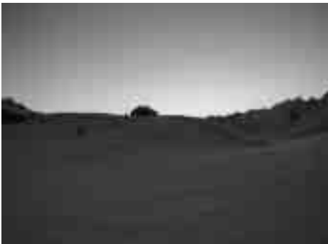
Capanna Corno-Gries: Morgenstimmung.

Plötzlich wird die Abfahrtsfreude jäh unterbrochen. Marlies liegt mit schmerzverzogenem Gesicht im Schnee. Neuschnee, Süd-