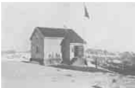
Spitzmeilenhütte SAC, 1904.