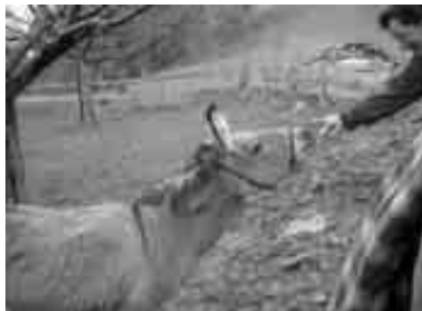
Nette Begegnungen unterwegs ...

In St. Margrethen entsteigen wir aus unserem reservierten Bahnwagen. Auf dem Perron versammelt und begrüsst sich die 19-köpfige Wanderschar mit Schäferhund. Vom Bahnhof aus geht's zu einer ersten Stärkung ins Mineralheilbad. Von hier aus beginnt die Wanderung in der frisch verschneiten Landschaft vorerst durch Quartierstrassen, dann bergwärts durchs Glaserholz - Schäflisberg - Hinterrüti - Burghalde - unserer wohlverdienten Mittagsrast im Gasthaus Rössli beim