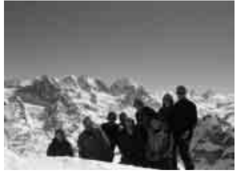
Gipfelfoto auf dem Piz Surlej.

Flüssiges und Festes in unser Innerstes zu befördern, dann strebten wir schon wieder weiter der Sonne entgegen. Am Gipfel des Piz Mezdi lachte uns diese dann tatsächlich vollends ins Gesicht. Der Ausblick war grandios. Vor uns seht der einzige Viertausender der Ostalpen, der Piz Bernina, in seiner ganzen Pracht. Die Rast ist nur von kurzer Dauer, denn der Weg über den Rosatschkamm ist noch weit und etwas mühsam. Auf unserem Weiterweg sind wir fasziniert von den Ausblicken dieser Gratwanderung. Rechts, tief unter uns die Seenlandschaft des Oberengadins sowie mit den Orten Maloja, Sils/Maria Silvaplana und St.Moritz. Links die Fels und Eisriesen der Bernina Gruppe. Wir sind mittlerweile am Piz San Gian angekommen. Hier werden die Ski auf unsere Rucksäcke geschnallt, da der weitere Weg nur zu Fuß möglich ist. Wenig später sind wir am Ziel unserer Schitour angelangt. Der Gipfel des Piz Surlej mit seinen 3188 m Höhe, sowie die wohlige Wärme der hochstehenden Sonne laden uns zu einer ausgiebigen Rast ein. Selbst einem Mittagschläfchen steht nichts mehr im Wege. Leider hat halt alles