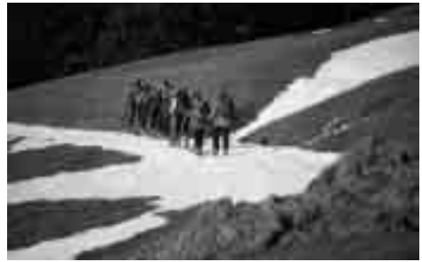
Richtung Piz Pazzola.

Auch die Abfahrt konnte sich sehen lassen. Besonders die Kurven durch die Lärchen hinab waren für Reaktionsschnelle ein Leckerbissen. Kaffee trinken im blühenden Olivone rundete auch diesen gelungenen Tag ab.