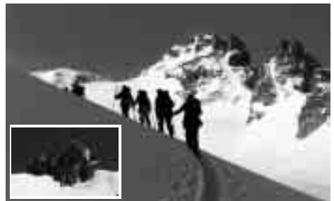
Aufstieg zum Pizol und Gipfelfoto.

Umleitung: Die Tour führt wegen schlechter Wettervorhersage und angeblicher Lawinengefahr auf den Pizol.