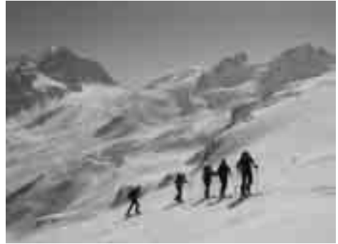
Aufstieg zum Piz Chapütschin.

Nach einem ausgiebigen Frühstück ging es auf vier Rädern zur Talstation der Corvatsch-Luftseilbahn. Die moderne Technik beförderte uns nun recht zügig in die etwas dünnere Luft inmitten der Engadiner 3000er Bergwelt. Kaiserwetter und kühle Temperaturen waren Treibstoff genug nun endlich etwas für unsere Gesundheit zu tun. In