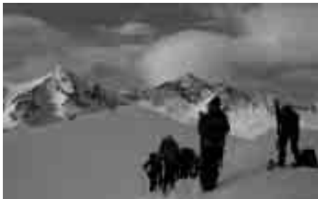
Toroi - Lukmanier.

Offenbar gab es für den heutigen Tag kleine Kommunikationsprobleme, wer den Tourenbericht schreiben sollte. Vom Dienstag