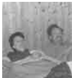
früh morgens ...