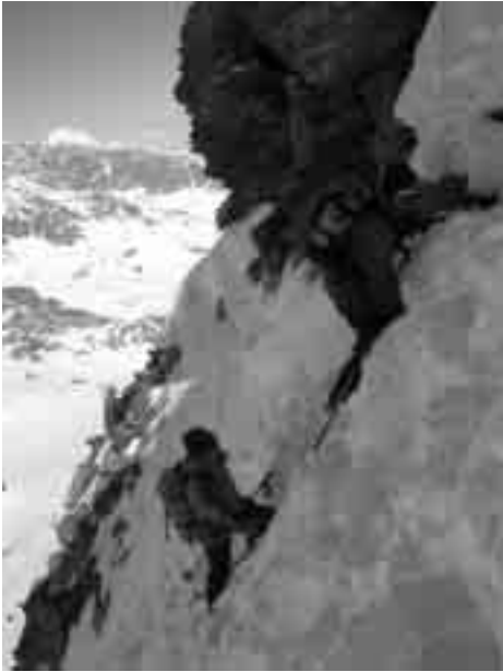
Die letzten Meter zum Piz Chapütschin.

Flüssiges und Festes in unser Innerstes zu befördern, dann strebten wir schon wieder weiter der Sonne entgegen. Am Gipfel des Piz Mezdi lachte uns diese dann tatsächlich vollends ins Gesicht. Der Ausblick war grandios. Vor uns seht der einzige Viertausender der Ostalpen, der Piz Bernina, in seiner ganzen Pracht. Die Rast ist nur von kurzer Dauer, denn der Weg über den Rosatschkamm ist noch weit und etwas mühsam. Auf unserem Weiterweg sind wir fasziniert von den Ausblicken dieser Gratwanderung. Rechts, tief unter uns die Seenlandschaft des Oberengadins sowie mit den Orten Maloja, Sils/Maria Silvaplana und St.Moritz. Links die Fels und Eisriesen der Bernina Gruppe. Wir sind mittlerweile am Piz San Gian angekommen. Hier werden die Ski auf unsere Rucksäcke geschnallt, da der weitere Weg nur zu Fuß möglich ist. Wenig später sind wir am Ziel unserer Schitour angelangt. Der Gipfel des Piz Surlej mit seinen 3188 m Höhe, sowie die wohlige Wärme der hochstehenden Sonne laden uns zu einer ausgiebigen Rast ein. Selbst einem Mittagschläfchen steht nichts mehr im Wege. Leider hat halt alles